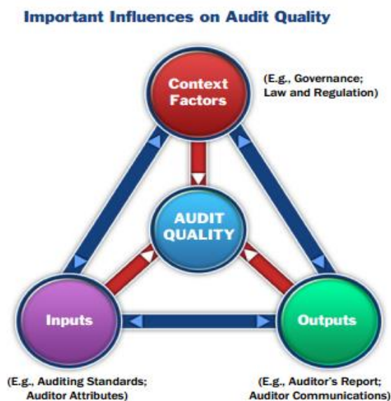
Figur 1 Important Influences on Audit Quality