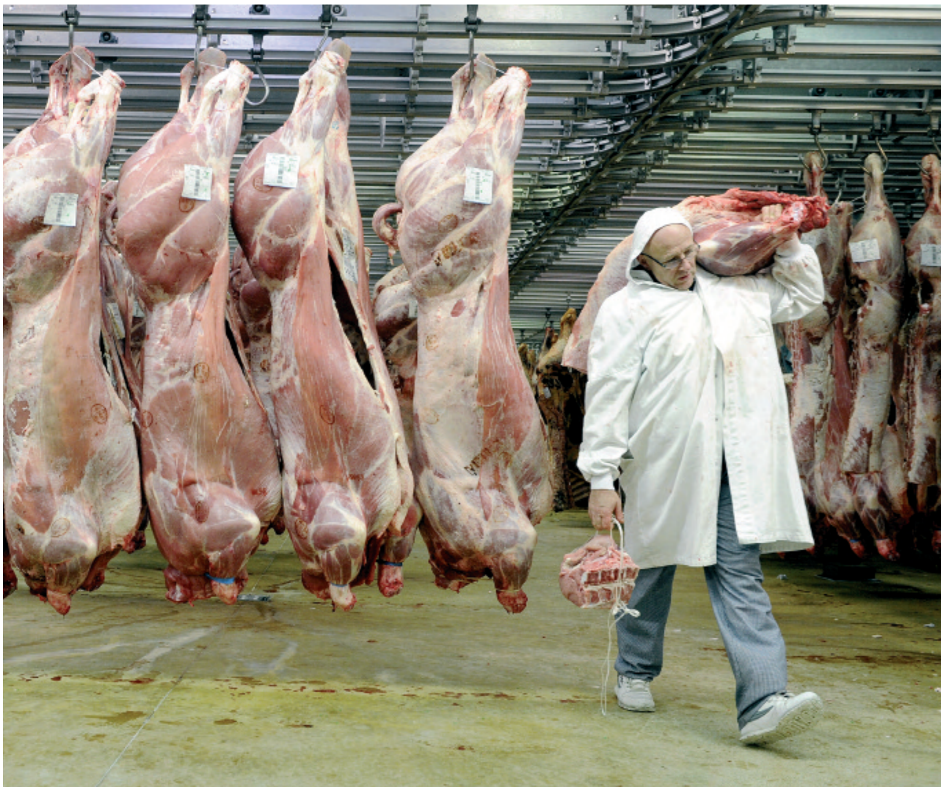
PÅ MATMARKEDET MARCHÉ DE RUNGIS UTENFOR PARIS STUDERER INTERNASJONALE TOPPLEDERE DYRESKROTTENE SOM DINGLER FRA KROKENE I TAKET. DE DELTAR PÅ BEDRIFTSINTERNE PROGRAMMET SOM AFF OG HEC PARIS HAR UTVIKLET FOR NUTRECO.