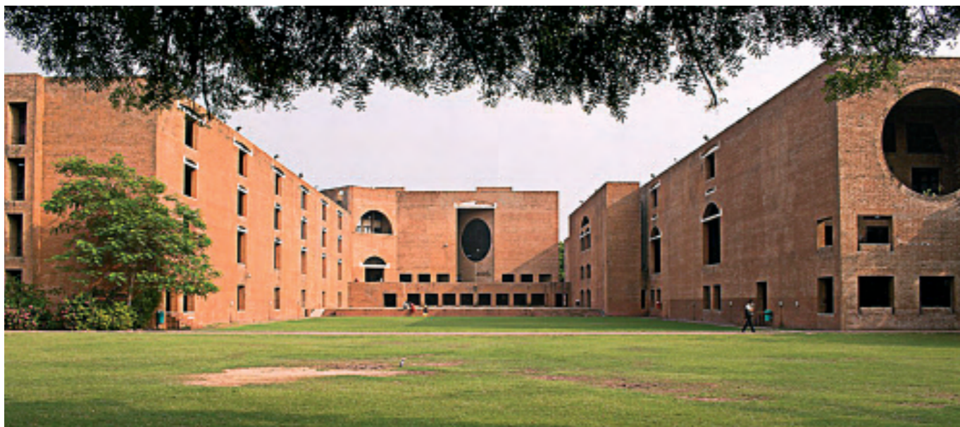
INDIAN INSTITUTE OF MANAGEMENT I AHMEDABAD.

Det svært lave lønnsnivået har nok noe å gjøre med dette. På campus har vi en kaffeautomat, hvor eieren har funnet ut at det er billigere å ha en person ansatt på heltid til å trykke på kaffeknappen og ta imot penger, enn å få installert et myntinnkast.