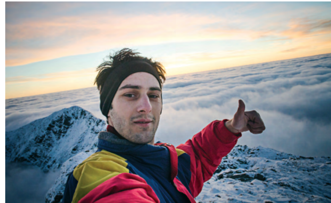
SLIK GJER DU DET: LEGGJER EIT BILETE PÅ INSTAGRAM, SAMSTUNDES SOM DU ER OPPTOKEN AV Å FORTELJE ANDRE KVA DU GJER AKKURAT NO. DU VIL HA APPLAUS FRÅ VENENE DINE I FORM AV «LIKES» (ILL.FOTO).

Datamaterialet frå trendstudien som gav grunnlag for trenden «alltid logga på», gjorde at han ville gå vidare med ein empirisk studie av kva som ligg bak ekstrembruken av smarttelefonar.