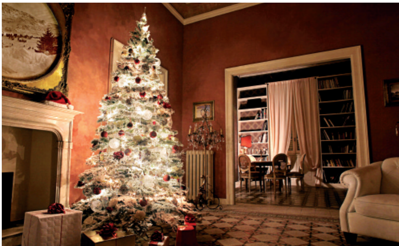
«STOVA MI», EIT SVÆRT POPULÆRT TEMA PÅ SOSIALE MEDIUM.