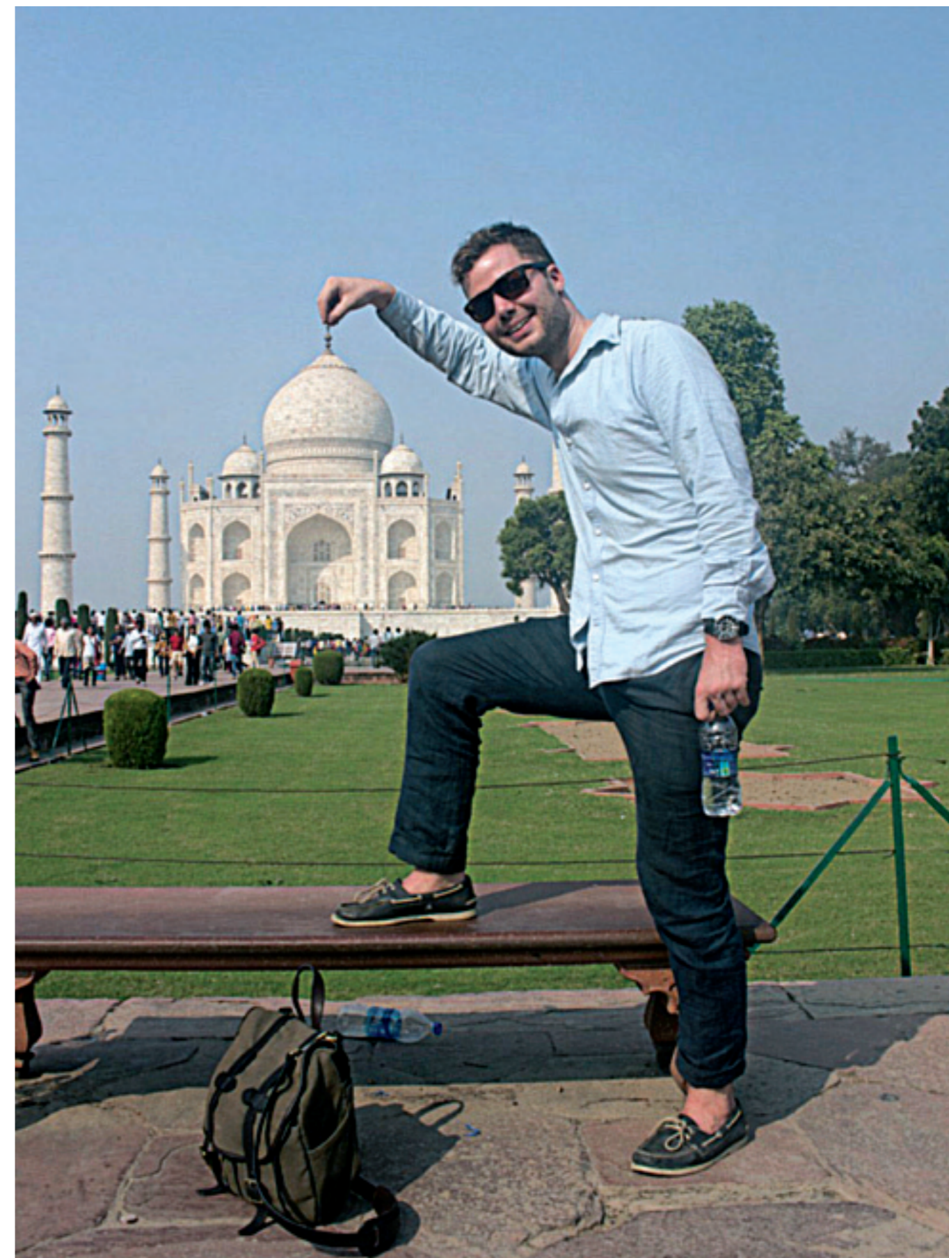
TØYER TURISTSTRIKKEN SÅ LANGT DET GÅR.

”Kanskje-holdningen hos endel indere er vrien å forholde seg til, og den gjelder også i forretninger. Derfor synger vestlige som outsourcer til India omkvedet om å spesifisere, spesifisere, spesifisere. Erik Jarle Nordbø