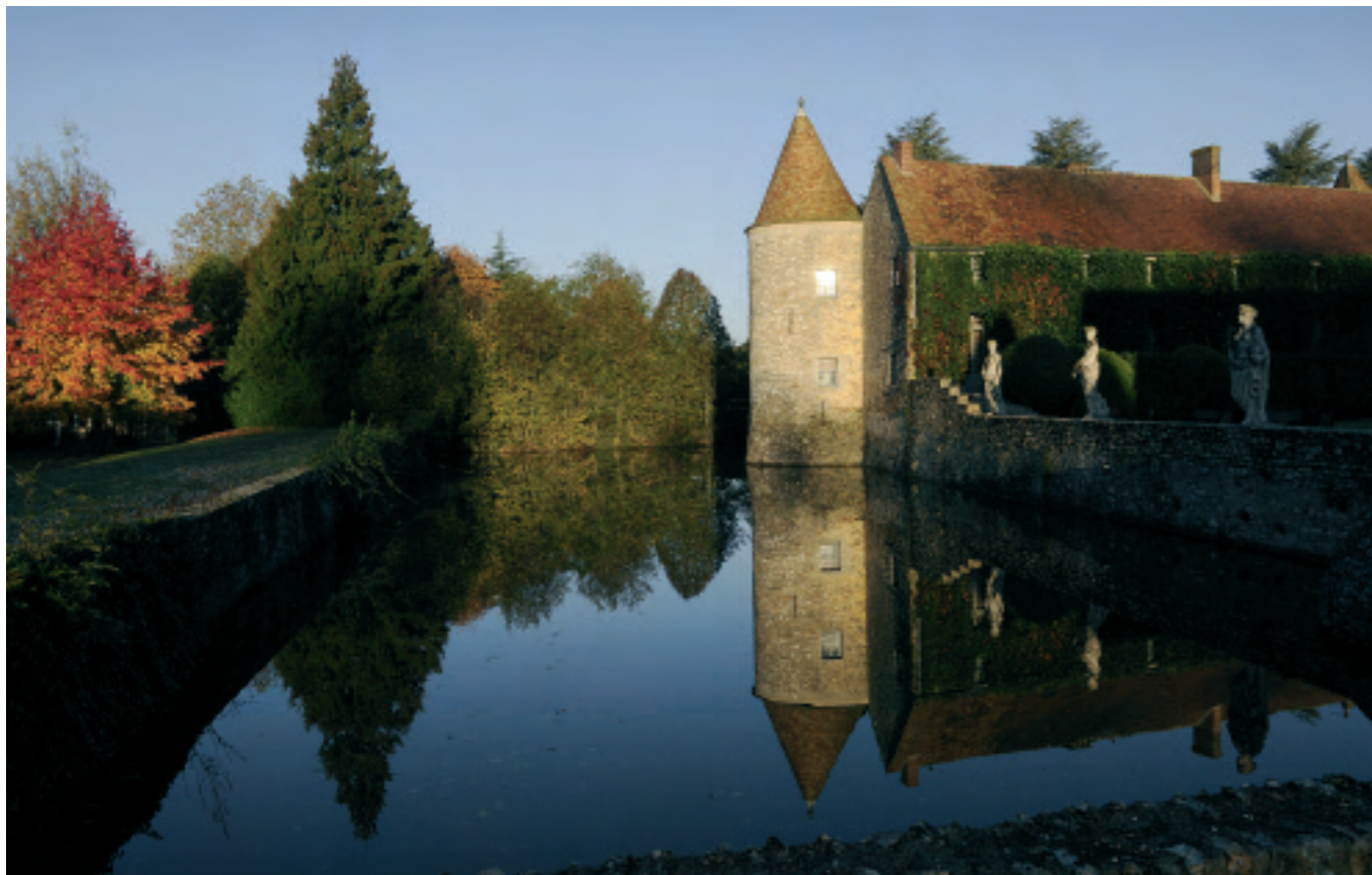
SLOTTET CHÂTEAU DE VILLIERS - LE MAHIEU ER OMGJORT TIL SPAHOTELL, DER DELTAKERNE PÅ LEDERUTVIKLINGSPROGRAMMET BODDE PÅ ANDRE SAMLING.