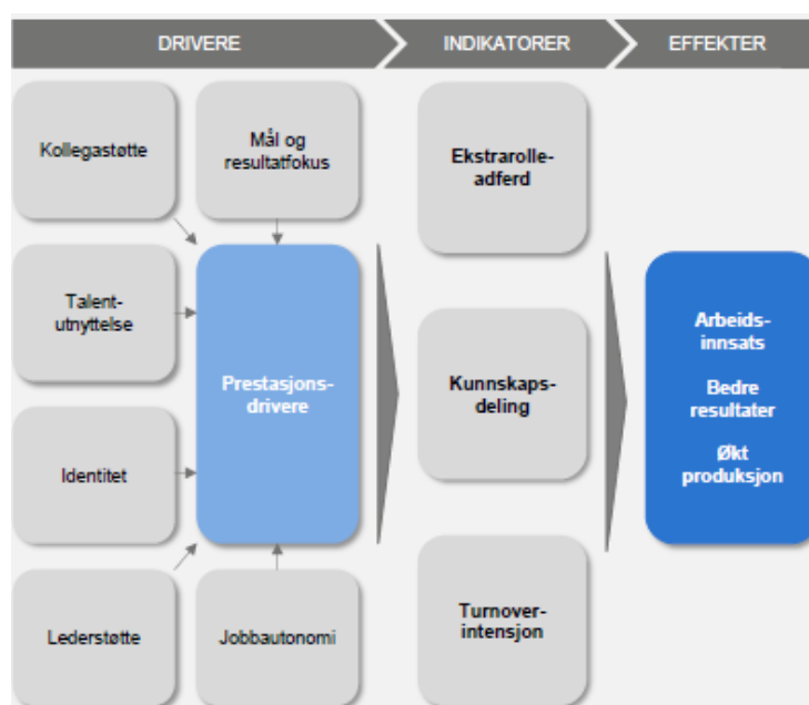
Figur 2: Forutsetningene for en prestasjonskultur. Gjengitt med tillatelse fra Varde Hartmark

Disse faktorene påvirker medarbeidernes indre motivasjon og drivkraft til å ville prestere og være en del av en prestasjonskultur. Videre trekker Varde Hartmark frem de tre indikatorene ekstrarolleatferd , kunnskapsdeling og organisasjonstilhørighet som måler kraften til den indre motivasjonen hos organisasjoner. Ekstrarolleatferd vil si at man gjør en ekstra innsats på jobben og påtar seg oppgaver utover det som er forventet. Kunnskapsdeling er til stede hvis man oppfordres til og faktisk deler og utvikler kunnskap i virksomheten, mens organisasjonstilhørighet handler om å ha et ønske om å fortsette i jobben og ikke tenke på å slutte (Varde Hartmark, 2013).