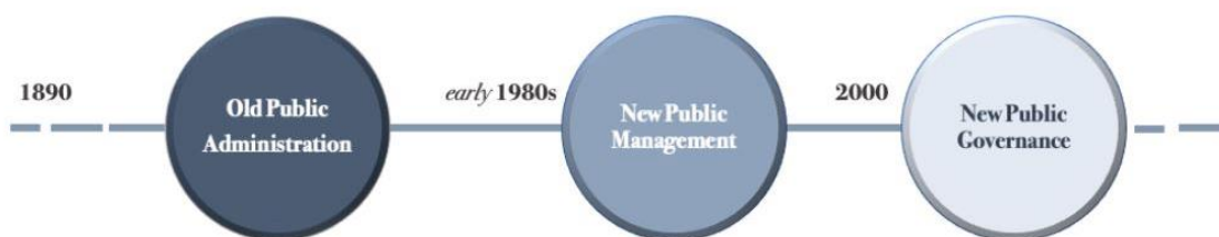
Figur 36: De tre dominerende modellene for styring og administrasjon av offentlige tjenester (Vignieri, 2020).

Styring og ledelse henger tett sammen slik vi omtalte i kapittel 4.1. Styring omhandler det systemiske og hvordan en prøver å påvirke menneskers adferd gjennom rammebetingelser, både administrative og økonomiske. Kommuner og det offentlige bruker styring. Her vil det være strukturen som legger føringer for hvordan samarbeidet blir, gjennom hvordan det blir organisert. Styring kan også brukes ved samarbeid mellom privat og offentlig sektor, der kommunen benytter seg av private aktører for å imøtekomme markedet. Styring er en av kjerneoppgavene til all politisk virksomhet og en av de viktigste oppgavene politikerne har er å styre samfunnet og utvikling det. Det involverer at politikerne tar avgjørelser og at vedtakene gjennomføres i praksis i samarbeid med administrasjonen (Røiseland & Vabo, 2016).